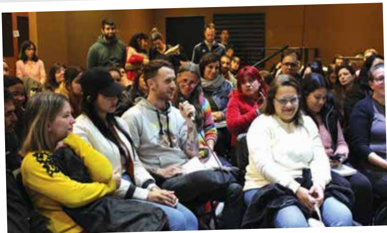
Comunidad. Con más de 500 asistentes, se llevó a cabo un plenario de la asignatura Trabajo Social Comunitario denominado "Territorializar para transformar".