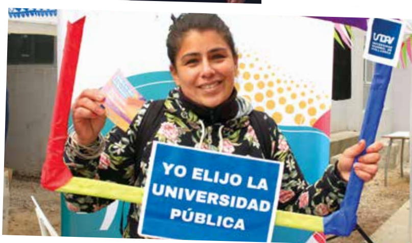
Día del/la estudiante. En el marco de las celebraciones organizadas por la Secretaría de Bienestar Universitario, se remarcó la importancia de seguir defendiendo la educación pública.

con información el periódico de la UNDAV coninformacion.undav.edu.ar