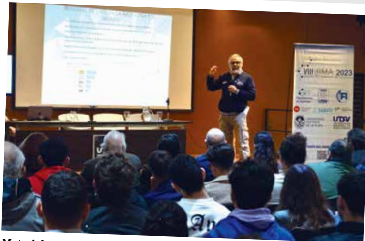
Materiales y energías renovables. Especialistas debatieron sobre el tema en el marco de las VIII Jornadas de Ingeniería en Materiales 2023.