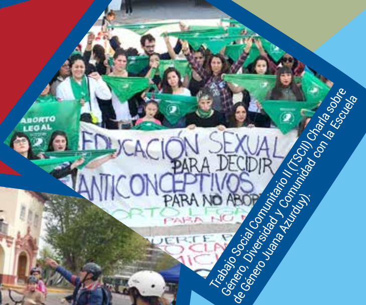
Trabajo Social Comunitario II (TSCII) Charla sobre Género, Diversidad y Comunidad con la Escuela de Género Juana Azurduy.