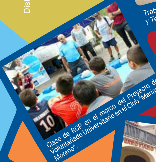
Clase de RCP en el marco del Proyecto de Voluntariado Universitario en el Club "Mariano Moreno".

Distribución libre y gratuita Prohibida su venta