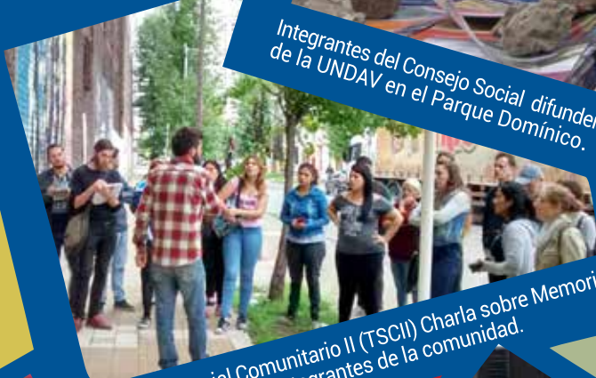
Trabajo Social Comunitario II (TSCII) Charla sobre Memoria y Territorio junto a integrantes de la comunidad.

Distribución libre y gratuita Prohibida su venta