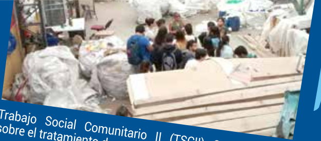
Trabajo Social Comunitario II (TSCII) Concientización sobre el tratamiento de residuos urbanos.