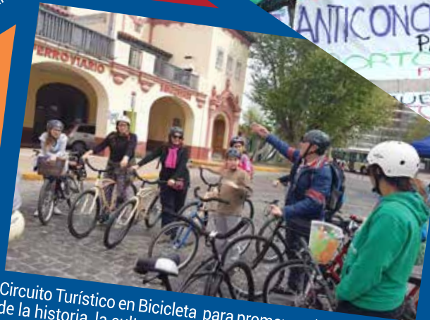
Circuito Turístico en Bicicleta para promover el conocimiento de la historia, la cultura y el paisaje de Avellaneda