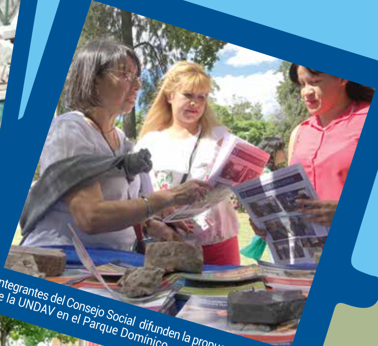
Integrantes del Consejo Social difunden la propuesta educativa de la UNDAV en el Parque Domínico.