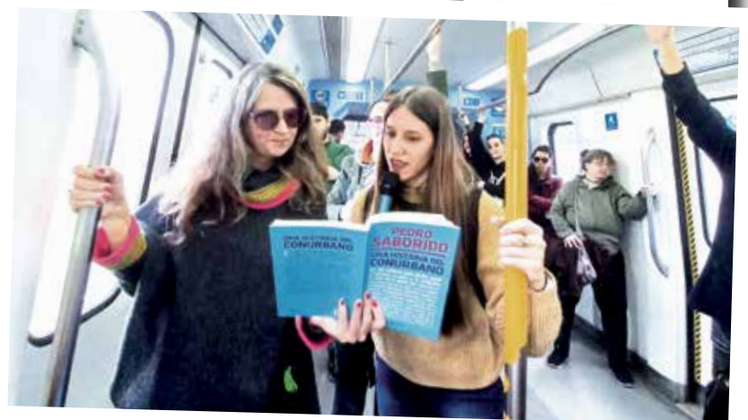
"Conurbano sobre rieles". Docentes y estudiantes de las carreras de Turismo realizaron un paseo en la Estación Darío Santillán y Maximiliano Kosteki con destino a las localidades de Hudson y Quilmes.

con información el periódico de la UNDAV