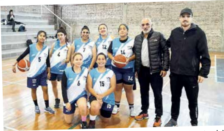
Hay equipo. El conjunto de básquet femenino de la Universidad Nacional de Avellaneda disputó su primer encuentro en el marco del Torneo Liga Universitaria del Sur ¡Felicitaciones!