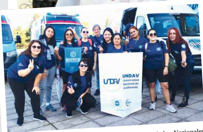
Comunidad. ANDUNA dijo presente en las Olimpiadas Nacionales Nodocentes. La Asociación NoDocente de la Universidad Nacional de Avellaneda compitió en fútbol 5 femenino y maratón femenino y masculino.

La UNDAV incorporó un muñeco simulador de alta fidelidad para la carrera de Enfermería. Ofrece una práctica segura y realista de las habilidades de enfermería, desde evaluaciones básicas y pensamiento crítico hasta intervenciones avanzadas.