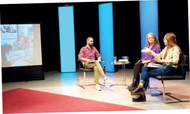
Narrando el Conurbano. Docentes de la UNDAV presentaron el proyecto Conurbano sobre rieles en el programa de UNITV Relatos Conurbanos.