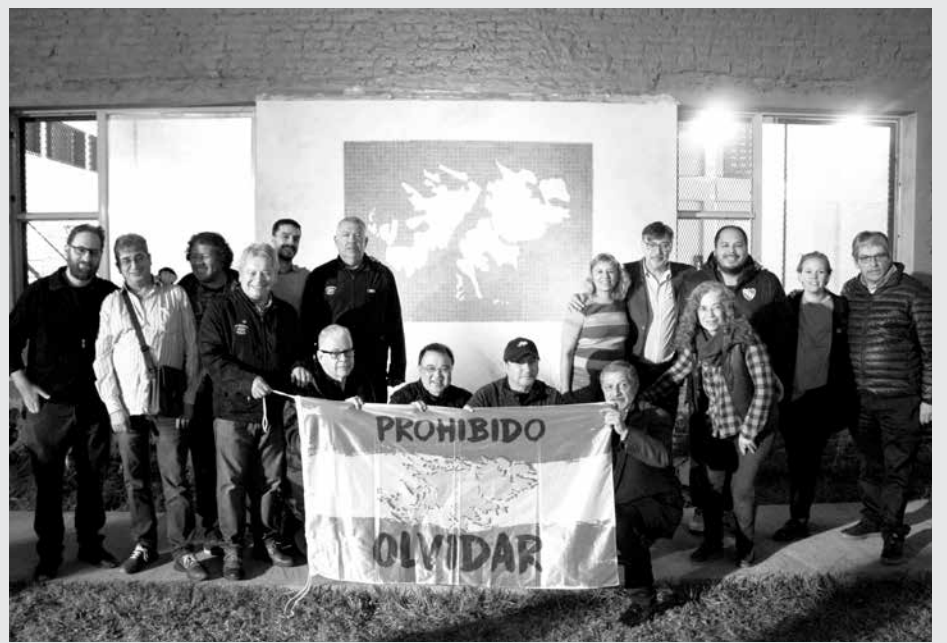
> Veteranos, autoridades y docentes en la inauguración del mural.

Cuando hablamos de Malvinas, la guerra es un lugar ineludible, es el punto de partida de muchas de