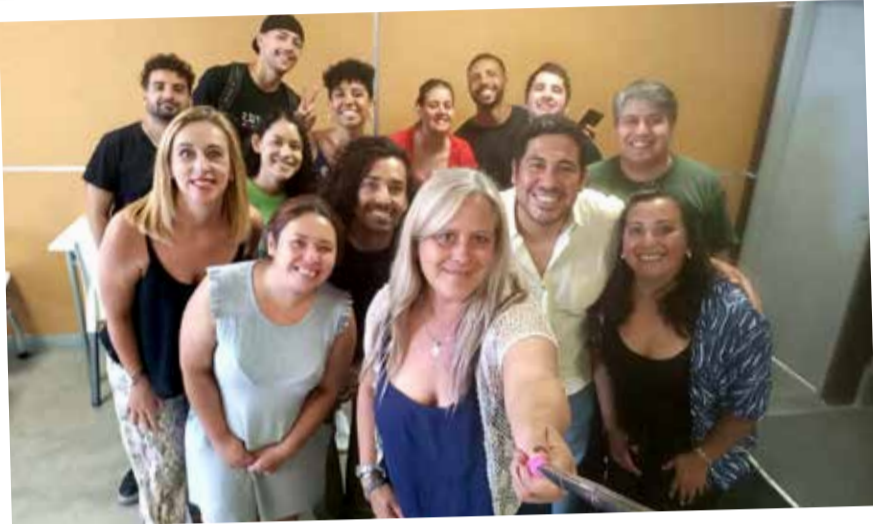
Encuentro. Tutores/as Pares del Programa Estudiantes en Red y estudiantes de intercambio de la Universidad Federal de Minas Gerais intercambiaron experiencias.