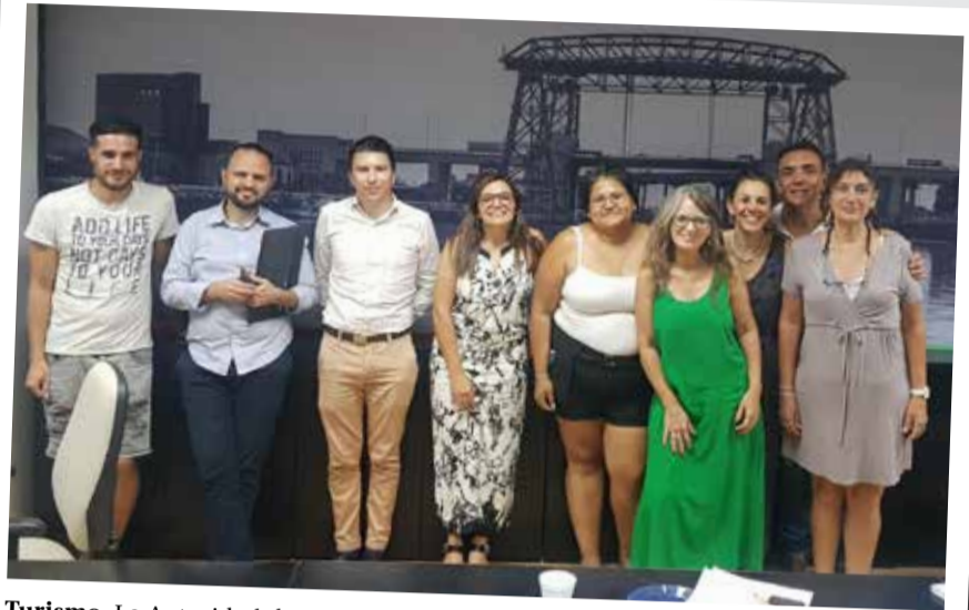
Turismo. La Autoridad de Cuenca Matanza Riachuelo y la Universidad Nacional de Avellaneda planean trabajar en la continuidad y el fortalecimiento del proyecto "Circuito turístico La Boca - Isla Maciel: El puente y sus orillas".