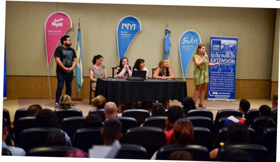
Educación. La UNDAV compartió un encuentro en San Vicente destinado a vecinos/as interesados/as en estudiar la Tecnicatura Universitaria en Seguridad e Higiene de la Industria Mecánico-Automotriz, a través del Programa Puentes.

con información el periódico de la UNDAV