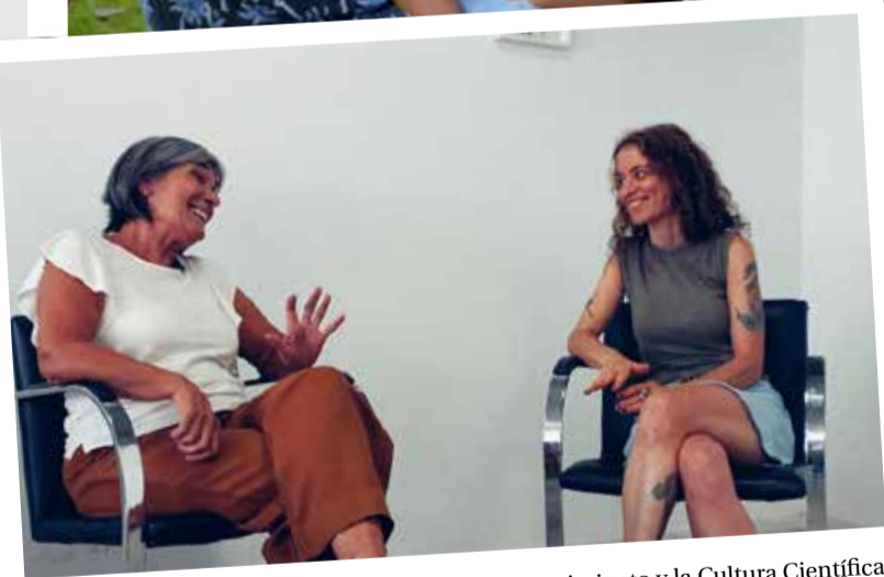
Cultura. El Programa de Popularización del Conocimiento y la Cultura Científica y el Laboratorio de Medios brindaron colaboración en el armado de la difusión audiovisual de la revista El Péndulo, del Departamento de Cultura, Arte y Comunicación.

Una pausa después de clases en el patio central de la Sede Piñeyro.