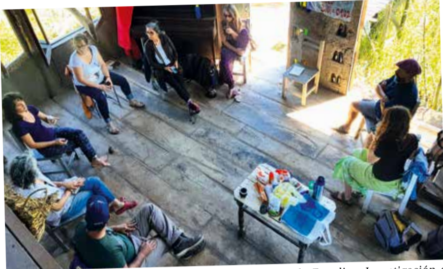
Protección de humedales. Docentes del Laboratorio de Estudios, Investigación e Intervención Territorial en Turismo de la UNDAV (LEITET) siguen trabajando en la comunidad I-TEKOA "Aldea de agua".