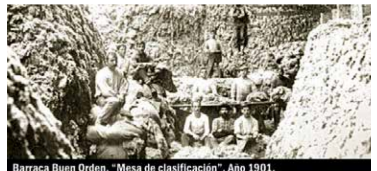
Barraca Buen Orden. "Mesa de clasificación". Año 1901.