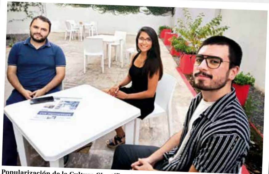
Popularización de la Cultura Científica. Becarios/as que participaron y participan de diferentes proyectos de investigación radicados en la UNDAV compartieron sus experiencias.