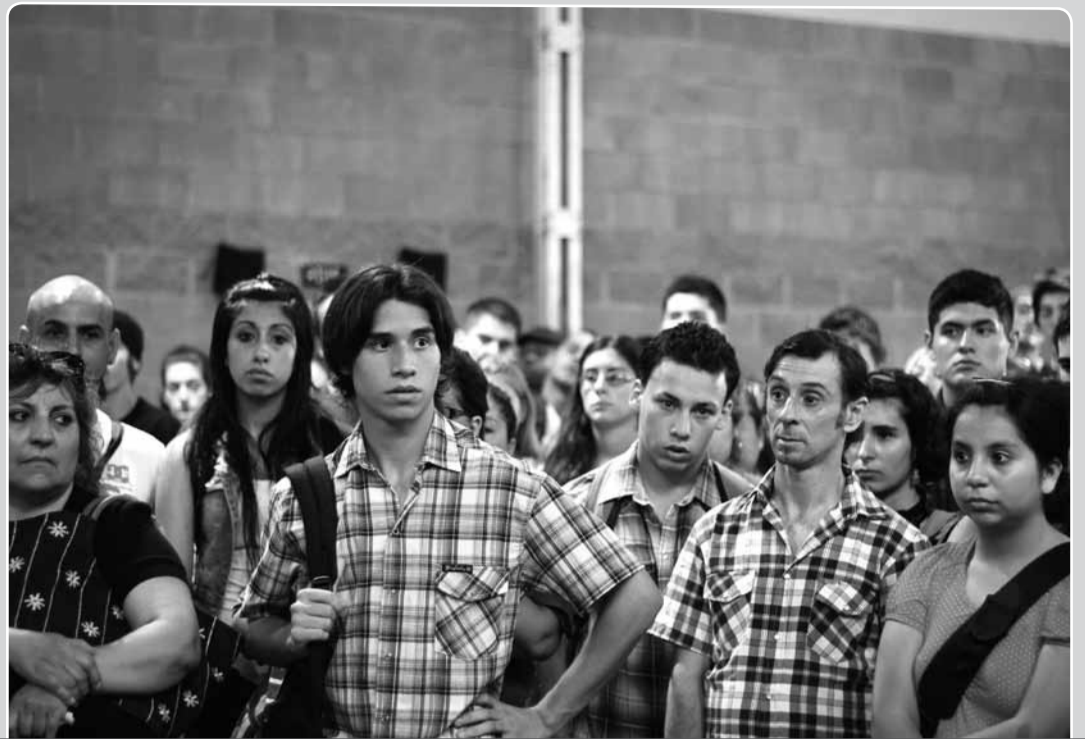
> Los encuentros se desarrollan de forma participativa reforzando los saberes de los futuros estudiantes.

La forma de evaluación será en base al seguimiento del proceso de aprendizaje de los estudiantes que culminará con la entrega de un trabajo monográfico. Es en base a la evaluación de proceso, la revisión del trabajo final y la asistencia, que se tomará la decisión sobre qué estudiantes ingresan en el primer cuatrimestre a cursar las carreras en las que se han inscripto y, cuáles deben asistir a encuentros especiales de acompañamiento que les permitan, en un plazo más extendido, poder adquirir las herramientas necesarias para comenzar y desarrollar sus estudios en mejores condiciones de aprovechamiento. ■