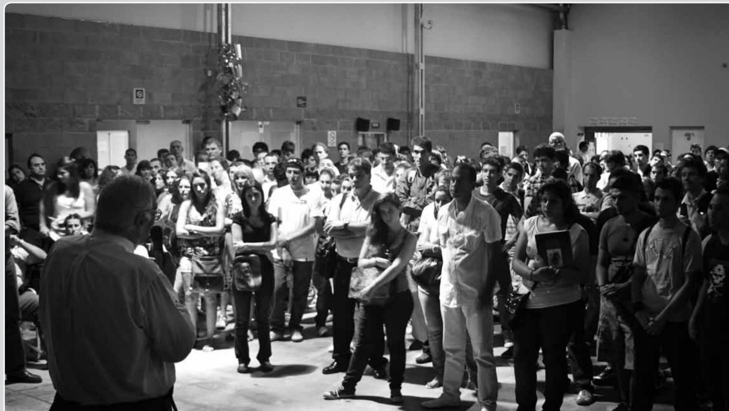
> El programa es una instancia integradora que busca introducir a los alumnos en la vida universitaria.

El miércoles 1 de febrero comenzó el dictado de los dos seminarios que integran el curso. El Programa busca acercar a los futuros universitarios al conocimiento de estrategias de aprendizaje para afrontar los estudios superiores.