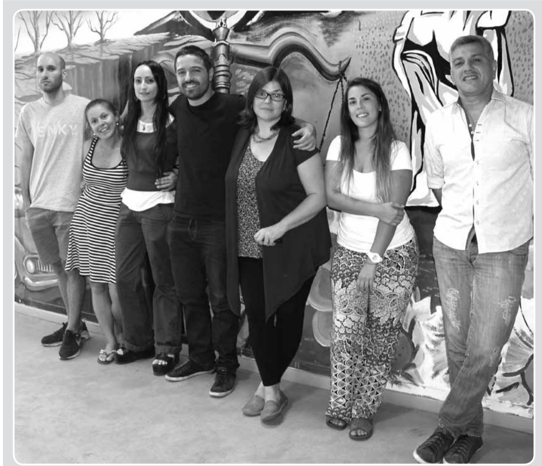
El equipo de la SBU comparte la misma pasión por el trabajo y el compromiso con toda la comunidad universitaria.

Para la SBU el trabajo en equipo y en forma articulada con el resto de las áreas, es fundamental. Tal es así que en lo que respecta a la salud, se trabaja con el Ministerio de Salud de la Provincia de Buenos Aires, con el Departamento Transversal de Salud y Desarrollo Comunitario y con