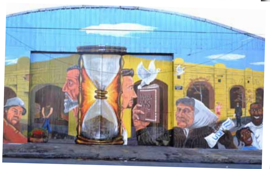
Del mercado a la Universidad. El mural frente a la Sede España es un vivo reflejo de la historia del lugar.

con información el periódico de la UNDAV Suscribite a la publicación mensual de la Universidad