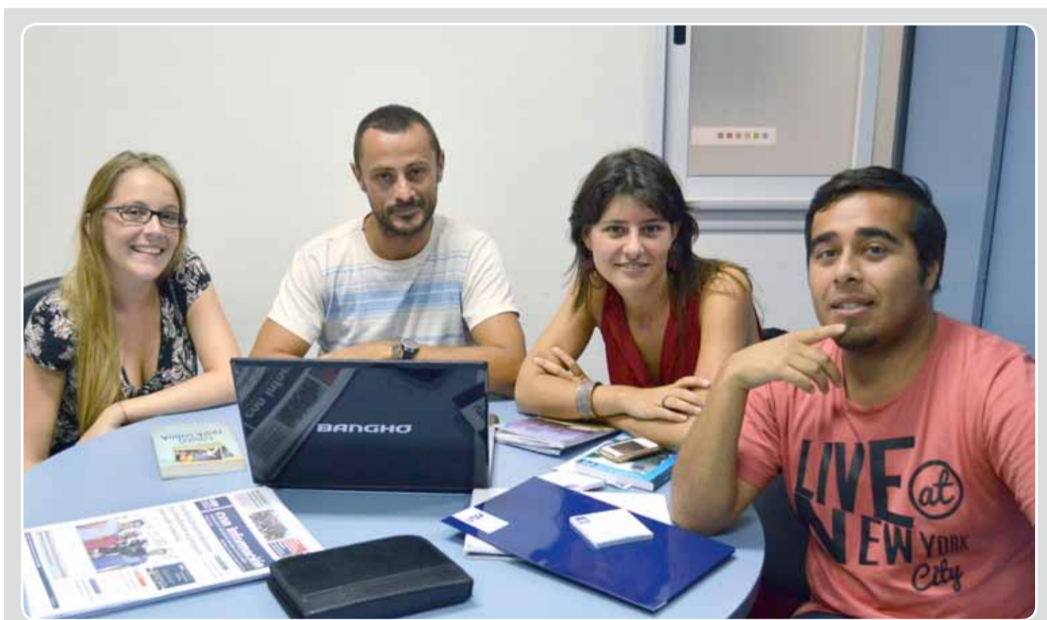
> Parte del equipo de trabajo del Observatorio, que tiene dependencia estructural de la Secretaría General de la UNDAV.

de Promoción Científica y Tecnológica del MINCYT, y tiene entre sus manos un desafío de sustancial relevancia como es el de asistir al gobierno y a la comunidad