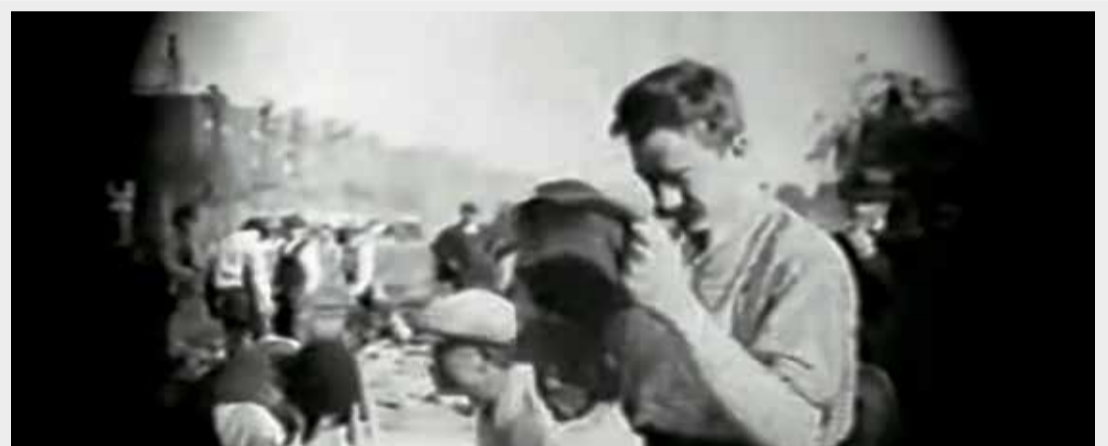
> Escena del largometraje “En pos de la tierra: episodio de la vida de un campesino” (1922).

Lo particular de esta lista de películas santafesinas es que se conservan imágenes en movimiento de aproximadamente la mitad de ellas, ya sea que se trate del largometraje completo o, como sucede en algunos casos, fragmentado. Este dato resulta muy interesante si tenemos en cuenta que el 90%