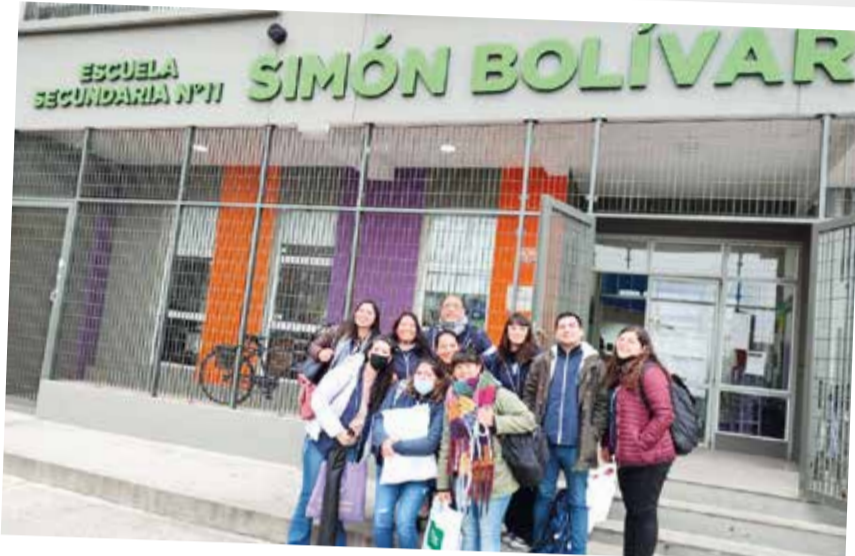
En la escuela. Integrantes de la Secretaría de Bienestar Universitario llevaron adelante un nuevo encuentro taller con estudiantes secundarios de la escuela N° 11 Simón Bolívar.