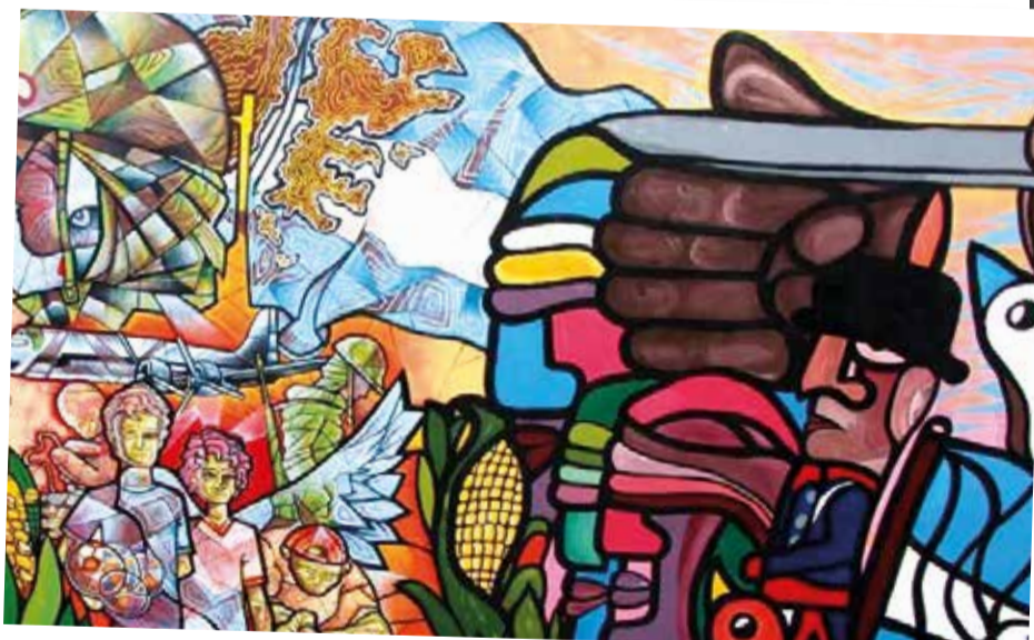
Arte. Muralistas latinoamericanos realizaron una obra en homenaje a Malvinas en la Sede Arenales.

con información el periódico de la UNDAV