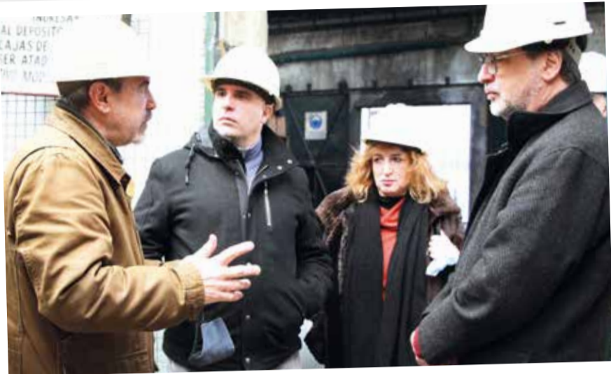
Industria local. Autoridades de la UNDAV visitaron la Fundición de Aceros SA, empresa con más de 70 años de historia en Avellaneda.