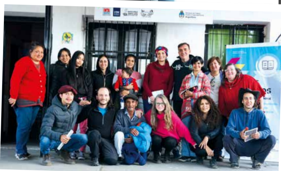
Turismo. Las carreras de Turismo de la UNDAV asistieron al cierre del Curso de Gestores Locales del Turismo Comunitario en Tucumán.

con información el periódico de la UNDAV