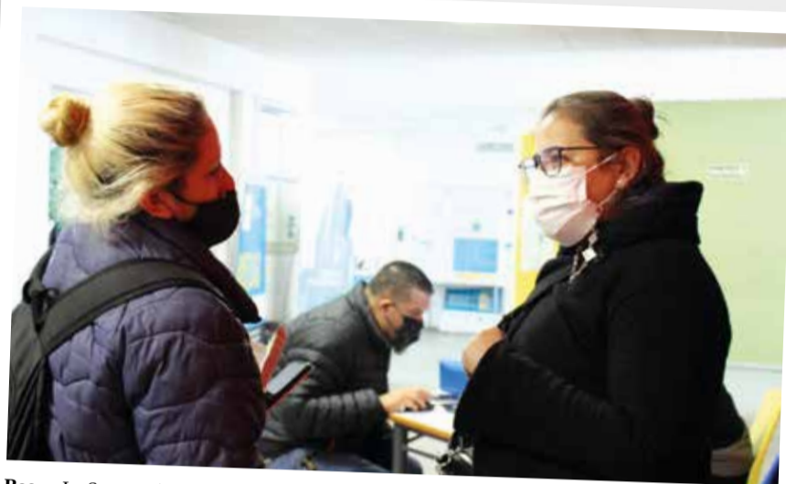
Becas. La Secretaría de Bienestar Universitario consolida sus espacios de contención, sostén y participación para garantizar el ingreso, permanencia y egreso de los/as estudiantes de la UNDAV que sean becarias/os del Programa PROGRESAR y otros programas de becas nacionales e institucionales.