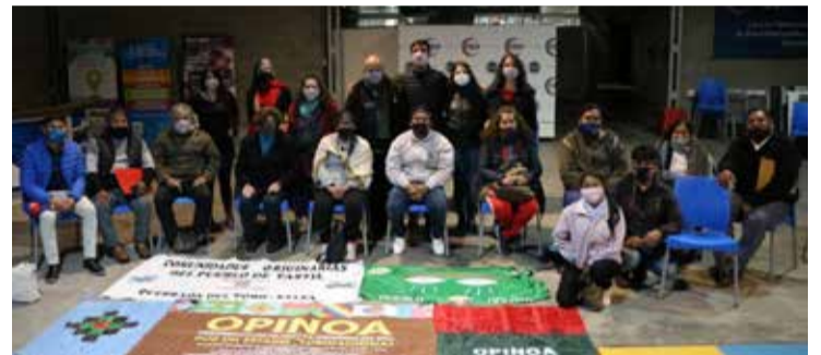
Visita de la delegación de OPINOA a la Sede España de la UNDAV (22/9/21).

Hoy, la prioridad es el resguardo del territorio. La universidad se ha manifestado a través de su Consejo Superior con las resoluciones 413/2019, apoyando la legislación sobre la propiedad comunitaria indígena, y 2/2021, sobre la necesidad de prorrogar la Ley 26.160 de Emergencia Territorial Indígena. Se viene desarrollando una arti-