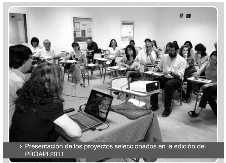
> Presentación de los proyectos seleccionados en la edición del PROAPI 2011