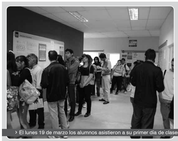
► El lunes 19 de marzo los alumnos asistieron a su primer día de clases