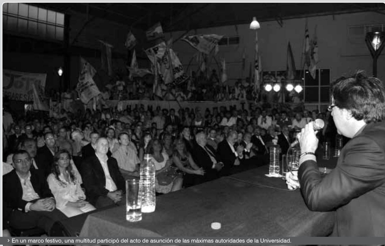
> En un marco festivo, una multitud participó del acto de asunción de las máximas autoridades de la Universidad.

La ceremonia de asunción de autoridades se realizó el lunes 19 de diciembre de 2011 luego de que fueran elegidos por la Asamblea Universitaria en su histórica primera sesión. La Universidad Nacional de Avellaneda se convirtió así en la primera de las nuevas universidades creadas desde el 2009 por el Gobierno Nacional en completar su proceso de organización.