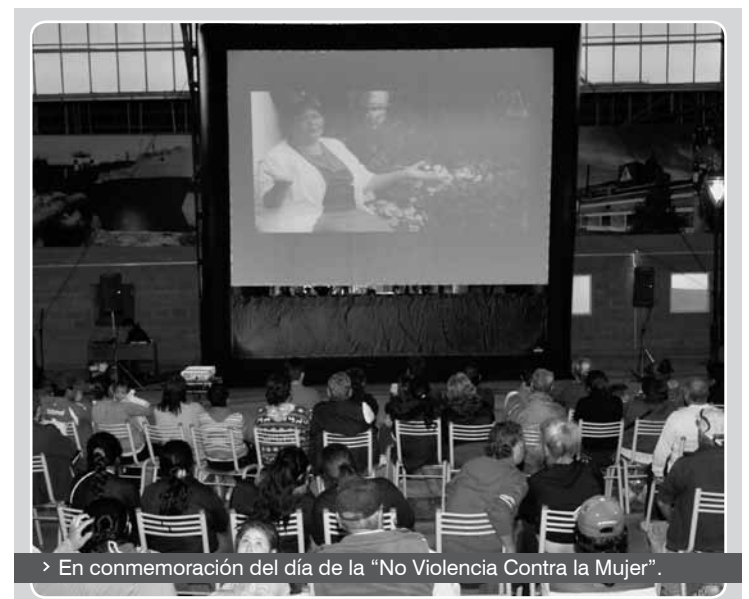
> En conmemoración del día de la “No Violencia Contra la Mujer”.

Cabe destacar que el pre estreno a nivel nacional se realizó en agosto con entrada libre y gratuita en el Cine Gaumont del espacio INCAA y contó con la participación de su directora y de todas “las muchachas”. ■