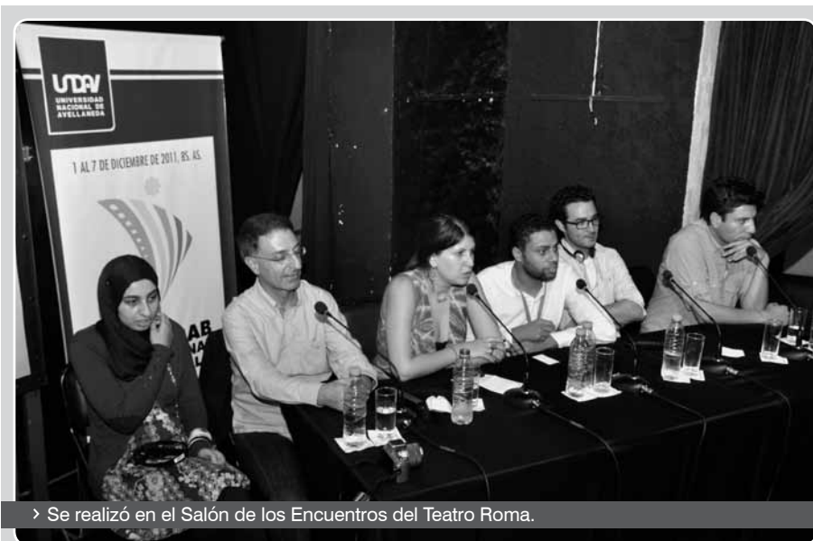
> Se realizó en el Salón de los Encuentros del Teatro Roma.