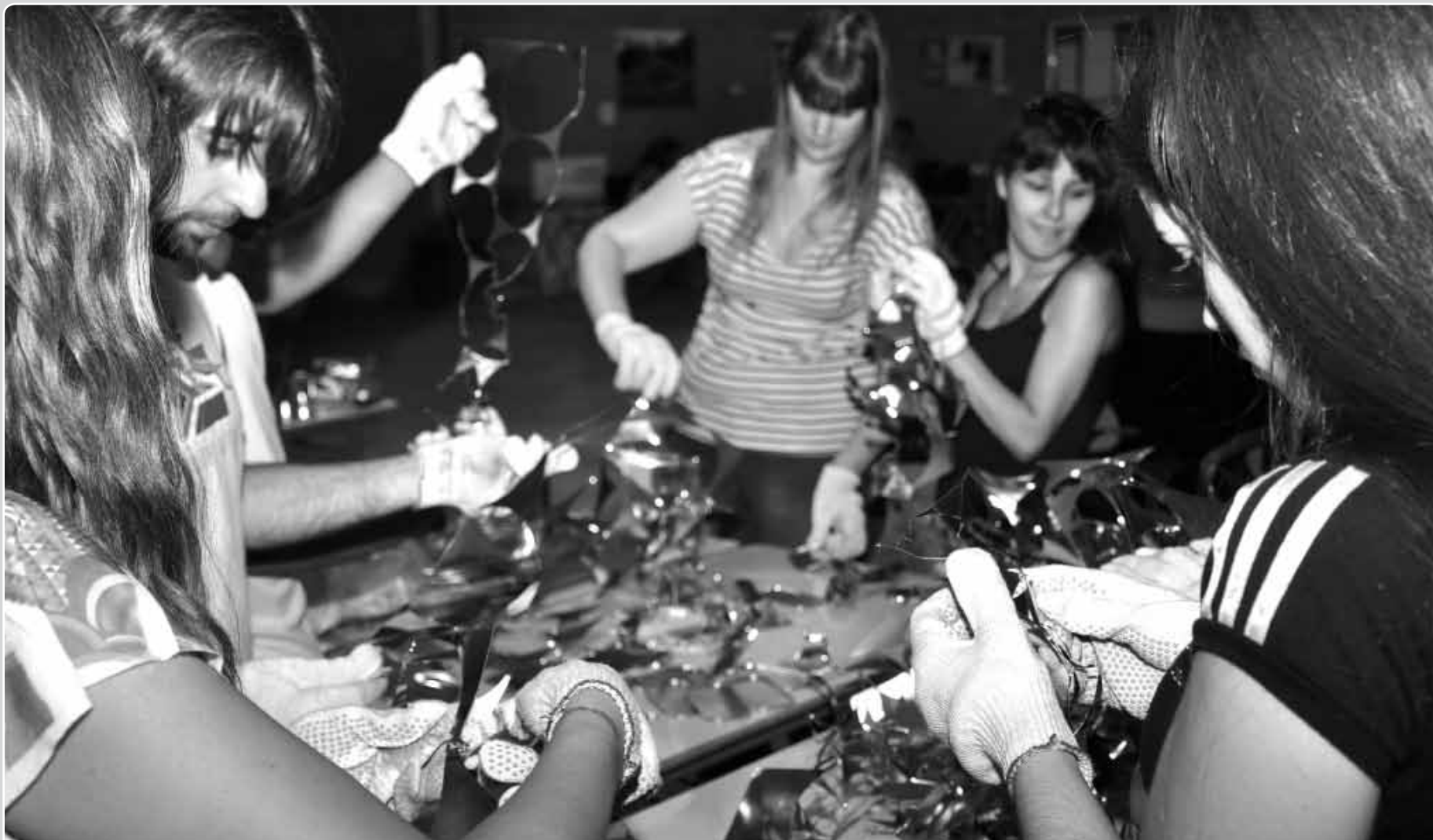
> Los trabajos realizados decoraron la sede de la Universidad.

Alumnos y docentes de la Tecnicatura en Diseño de Marcas y Envases crearon objetos decorativos con hojalata reciclada.