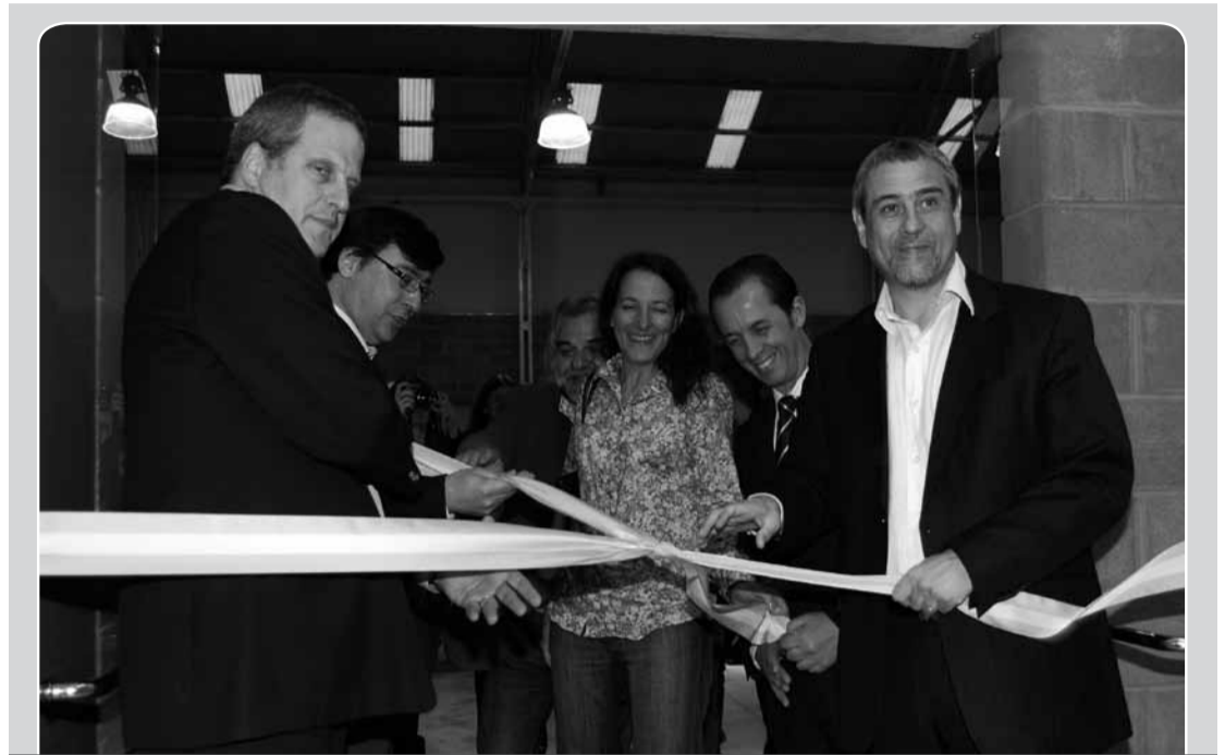
Las nuevas oficinas se encuentran ubicadas en la Sede de la Universidad, sita en España y Colón