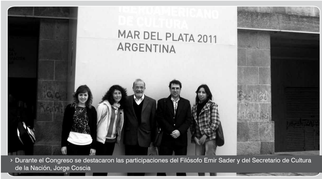
> Durante el Congreso se destacaron las participaciones del Filósofo Emir Sader y del Secretario de Cultura de la Nación, Jorge Coscia

Participaron de este encuentro de relevancia internacional que se realizó entre los días 15 y 17 de septiembre en la ciudad de Mar del Plata.