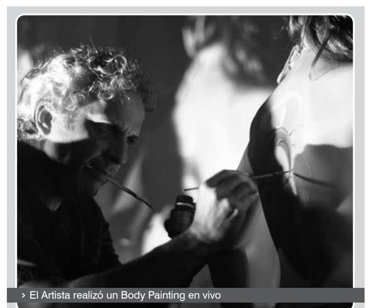
> El Artista realizó un Body Painting en vivo

Cabe destacar que "Viernes Compañeros" es una actividad recreativa y cultural organizada por la Universidad a través de su Secretaría de Extensión Universitaria con el objeto de constituirse en un espacio de encuentro de sus estudiantes, docentes y trabajadores. ■