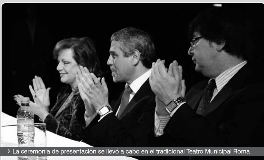
> La ceremonia de presentación se llevó a cabo en el tradicional Teatro Municipal Roma