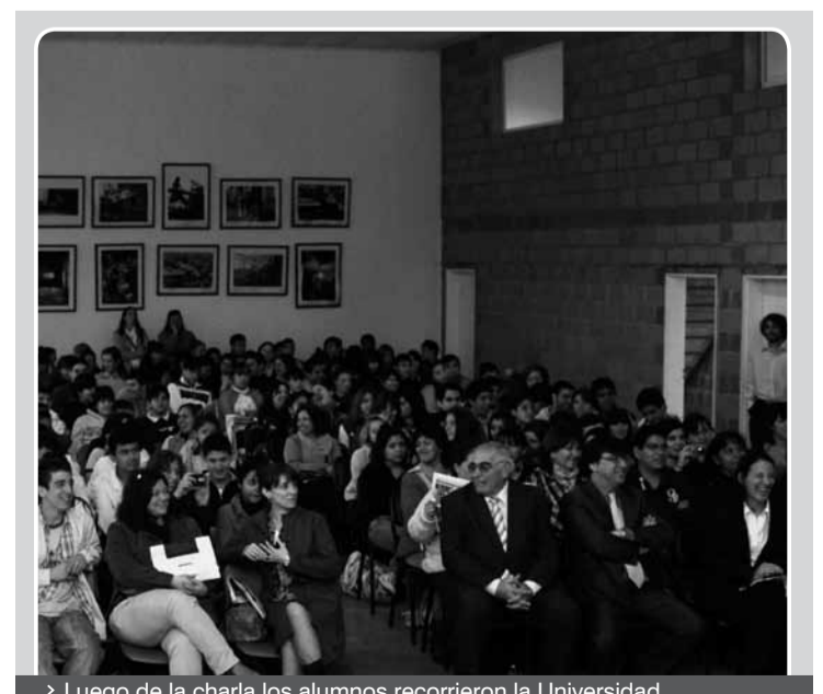
Luego de la charla los alumnos recorrieron la Universidad

Por otro lado, en el encuentro organizado el viernes 30 de septiembre, la UNDAV recibió a unos trescientos estudiantes provenientes de las escuelas EET N°8, ESB N°43, ESB N°22, EMM N°6, ESB N°2, EET N°14 - “Libertad”, EEM N°2 DE 4° y EET N°1. ■